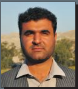
ليکوال: تاج محمد تمکين