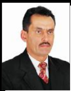
نویسنده: خارونکی احمدولید (حیدری) مشاور ارشد حقوقی دافغانستان بانک

راه های در آمد، بمیان آمدن انواع مختلف روابط تجاری، انتقال پول در داخل و خارج کشور ضرورت وضع قوانین جوابگو احساس شد. در اکثر