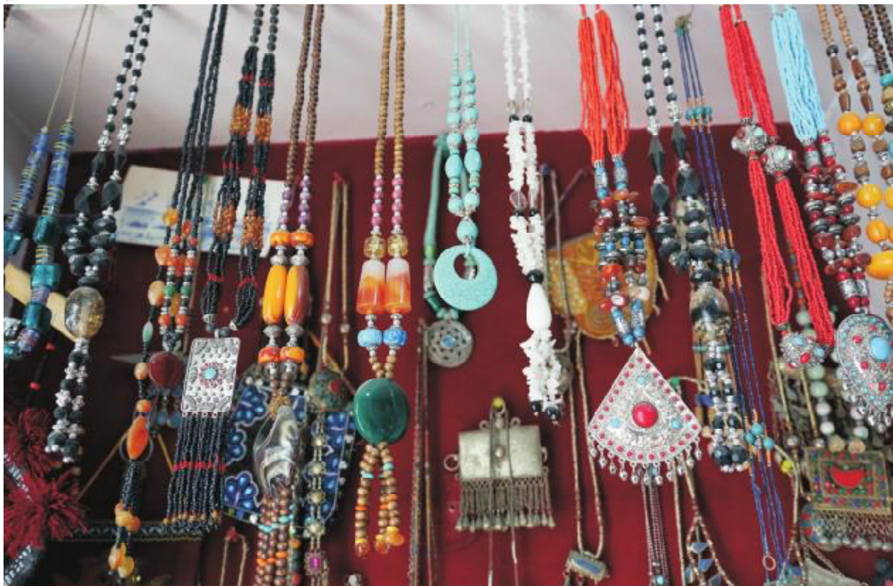
اووم کال، څلور اوایمه گڼه، د ۱۳۹۲ کال د زمري میاشت

۶- قیمتي کانې: د هېواد قیمتي کانې هم د هېواد په اقتصاد کې اساسي ونډه لري چې افغانستان بېلا بېل قیمتي کانې د سارې په ډول لاجورد، زمرد، یاقوت،