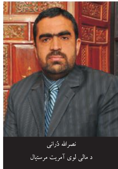
نصرالله ڈرانی د مالی لوی آمریت مرستیال

لږ لگښت سره د خپلو غټو هدفونو تر لاسه کول دي، نو په دې ډول هغوی هم د لگښتونو کمولو ته ډیر زیاته پاملرنه کوی. پس ثابته شوه چې په نړۍ کې شتون لرونکي انتفاعي او یا غیر انتفاعي اداري یا خو د خپلي گټي د زیاتولو په لټه کې وي او یا هم د مصارفو یا لگښتونو د کمولو په لټه کې وي. چې دا په خپله دا خبره خرگندوی چې د عوایدو زیاتول او د لگښتونو کنټرولول د هر ډول گټور (انتفاعي) یا بی گټي (غیر انتفاعي) بوختیا (فعالیت) له پاره ارزښمن اصل دی. همدغه د عوایدو د زیاتولو او لگښتونو د کمولو هڅی پخپله د مالی اداري یا فنانشل مینجمنټ له پاره اړین دی. نو پدی مانا چید محاسب کار یوازی د راکړو درکړو ثبتول نه دی، بلکه محاسبه په خپله د اداري په اړه پریکړو کې ډیر مهم رول لري. چې په دې لیکنه کې به د بهرنیو اړخونو له نظره په اداره کې د محاسبی رول ته کتنه