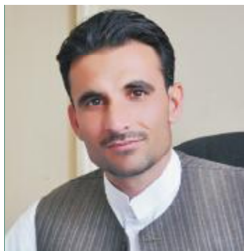
عين الله عيان

کم کړي، د گوتو په شمار د څارويو، چرگانو او مچيو له څو فارمونو پرته په افغانستان کې نور ټوله مالداري د عادي خلکو لخوا يعنې په هېواد کې کرنيز سيستم او مالدارۍ په سلو کې ۷۰ سلنه په کليوالي، کورني او دوديزه توگه ترسره کېږي. خو ځينې هېوادوال بيا د کرنې او مالدارۍ په برخه کې د دولت مرسته د پام وړ بولي او په افغانستان کې وروستيو بدلونونو ته په گتو سره د هېواد په بازارونو کې د کورنيو حيواني توليداتو کچه زياته په گوته کوي او په دې هيله دي چې د هر کال په تيريدو سره به مالداري عصري، توليدات به يې زيات او په دغه برخه کې به گڼو خلکو ته کارونه پيدا شي.