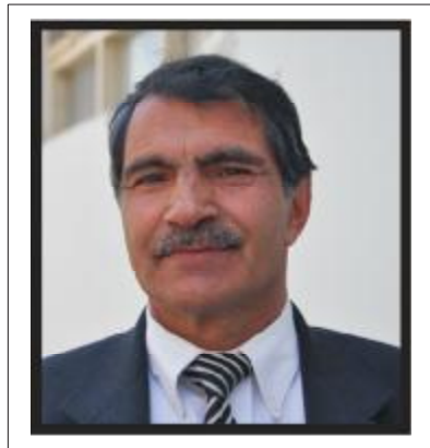
پيام معاون سر محقق محترم عبدالحکيم

په پای کې د افغانستان بانک او د هغه خپرونو څانګې ته د دغه مجلې د پنځه کلنې مبارکي وایم او ټولو ته په دې ارزښتناک او غوره کار کې ستر بریالیتوبونه غواړم.