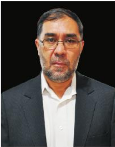
فکور بهشتی عضو ولسی جرگه

ها، امضای های اشخاص مسئول، شمارش بانکوتها و انواعیه آنها می باشد، بعد از طی مراحل تحت نظر هیئت موظف و امنیت کامل به کوره مخصوصیکه به همین منظور ترتیب شده است انتقال می شود در آنجا هم کاملاً تحت مراقبت جدی هیئت موظف و امنیت کامل قرار دارد، تا اینکه حریق می گردد. دروازه فلزی کوره قفل و توسط مهر و امضای هیئت قید میگردد الی کاملاً حریق شدن بانکوتها و از بین رفتن کامل آنها هیئت موظف در محل حضور می داشته باشد و بعد از ختم حریق باز هم کوره کنترل و چک می گردد که بعد از اطمینان کامل مراحل اداری آن طی می گردد. جای مسرت است که در ابتدا و انجام پروسه حریق در مورد اهمیت و شفافیت، همچنان نواقص کاری با مسئولین از جانب رئیس هیئت صحبت صورت می گیرد که سبب رفع اشتباهات و نواقص می گردد و در نهایت باعث شفافیت بیشتر و تنظیم بهتر پروسه حریق بانکوتهای مندرس میگردد. ●